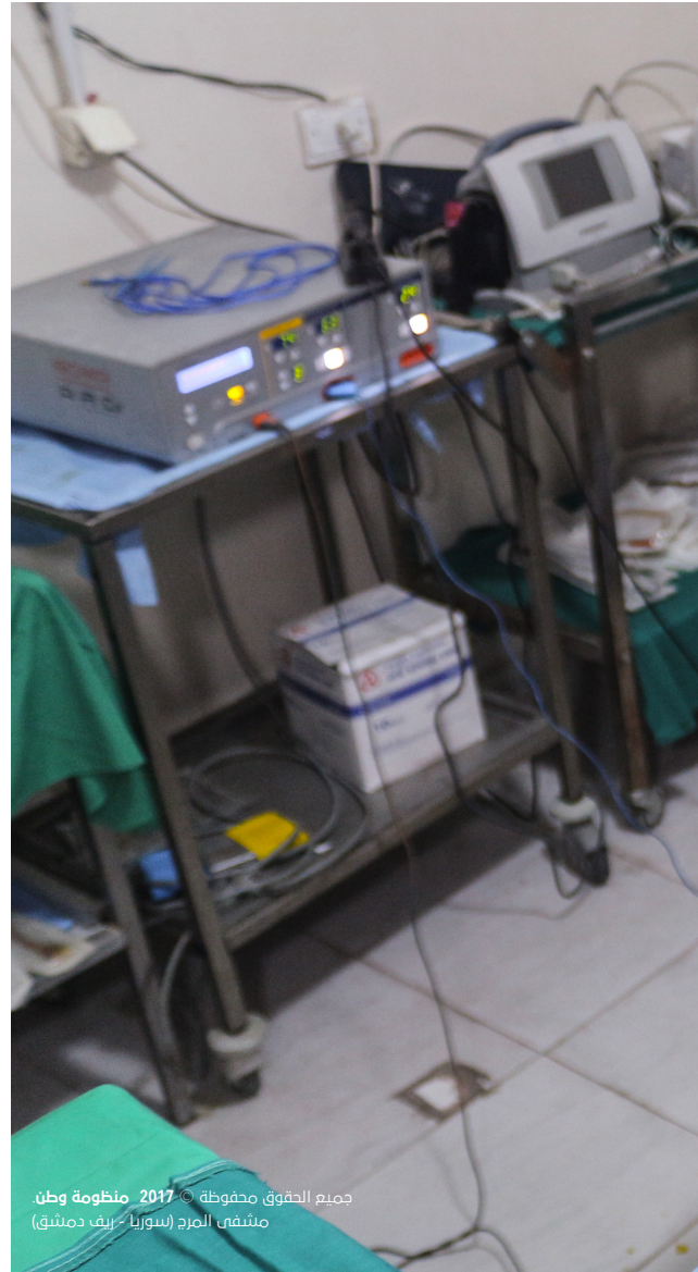
جميع الحقوق محفوظة © 2017 منظومة وطن مشفى المرد (سوريا - ريف دمشق)