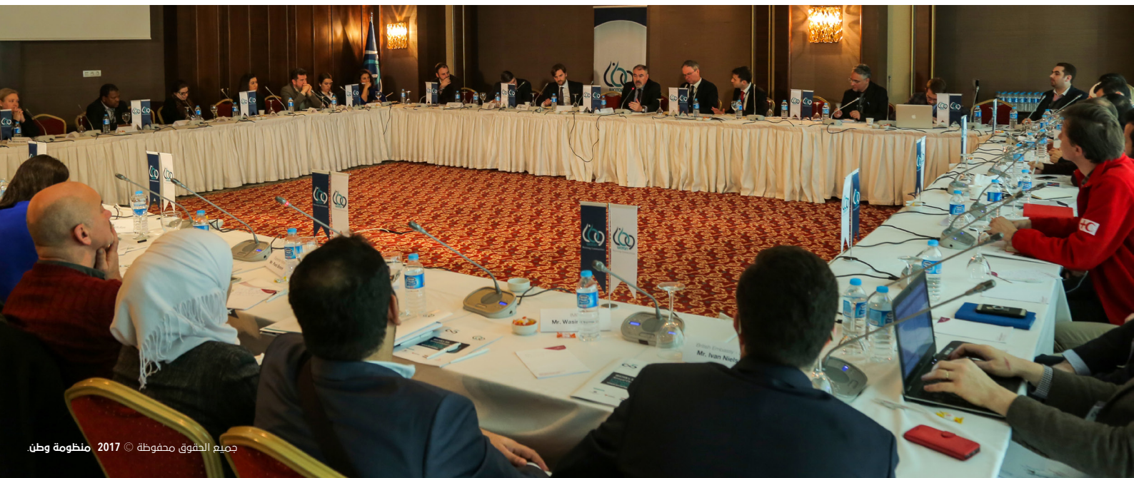
جميع الحقوق محفوظة © 2017 منظومة وطن