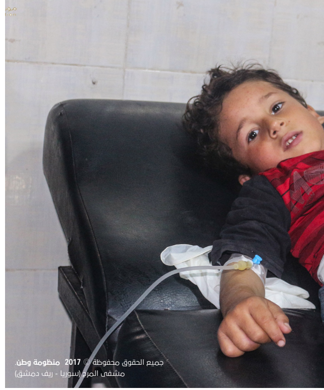
جميع الحقوق محفوظة © 2017 منظومة وطن مشفى المرد (سوريا - ريف دمشق)