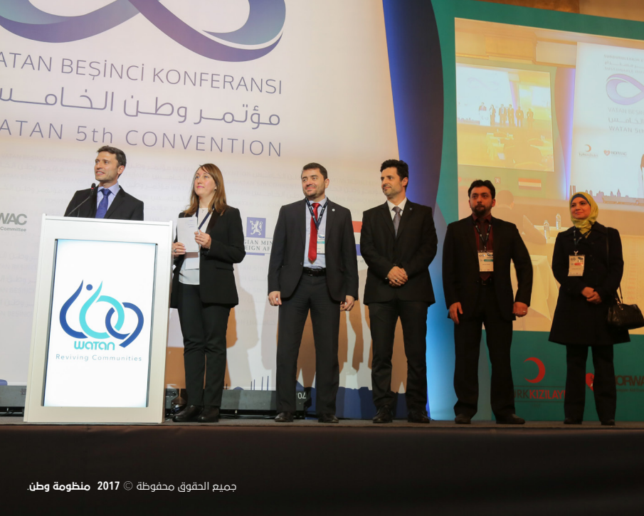
جميع الحقوق محفوظة © 2017 منظومة وطن