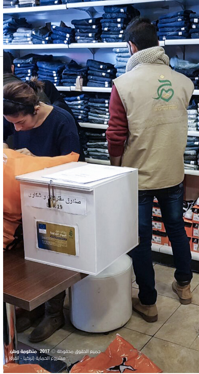
جميع الحقوق محفوظة © 2017 منظومة وطن مشروع الحماية (تركيا - أنقرة)