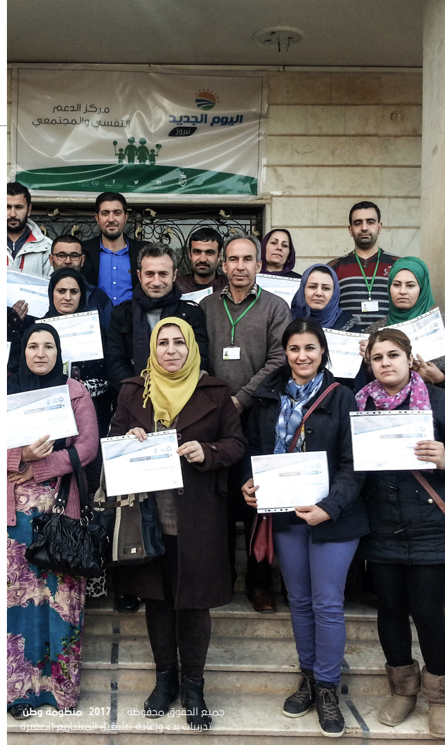
جميع الحقوق محفوظة © 2017 منظومة وطن تدريبات بدء وإعادة تشغيل المشاريع الصغيرة