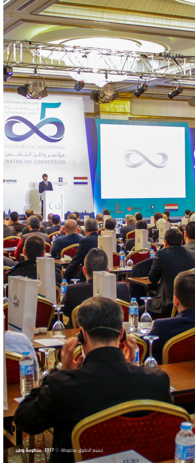
جميع الحقوق محفوظة © 2017 منظومة وطن