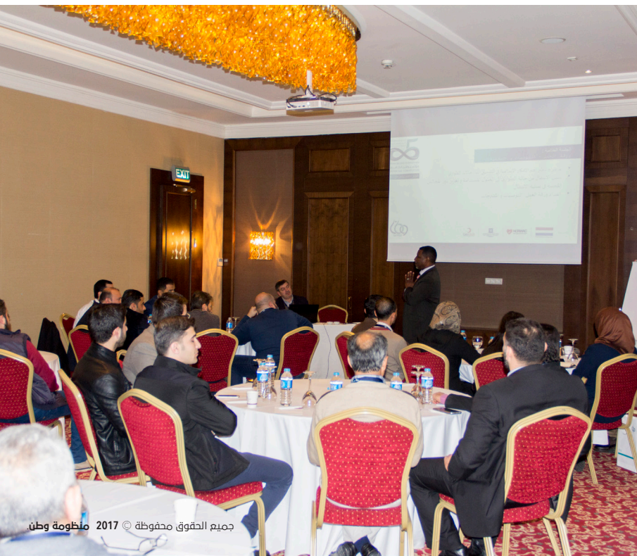
جميع الحقوق محفوظة © 2017 منظومة وطن