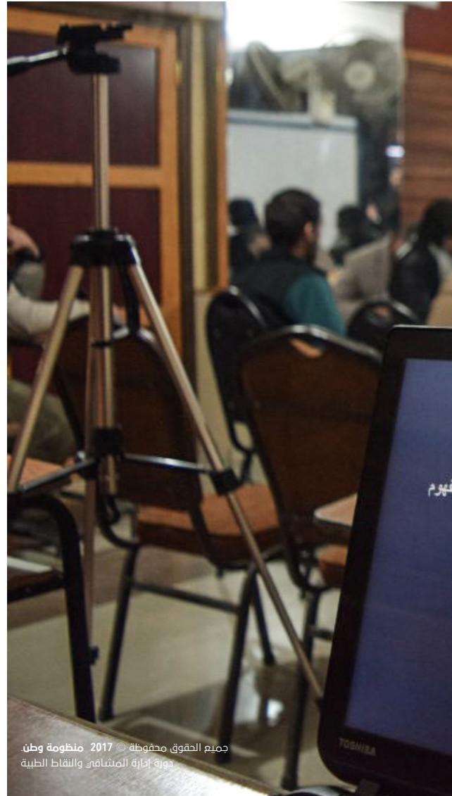
جميع الحقوق محفوظة © 2017 منظومة وطن دورة إدارة المشافى والنقاط الطبية