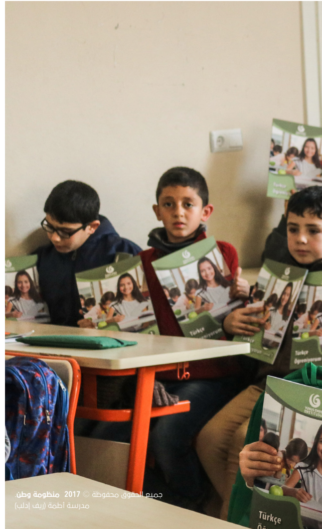
جميع الحقوق محفوظة © 2017 منظومة وطن. مدرسة أطمه (ريف إدلب)