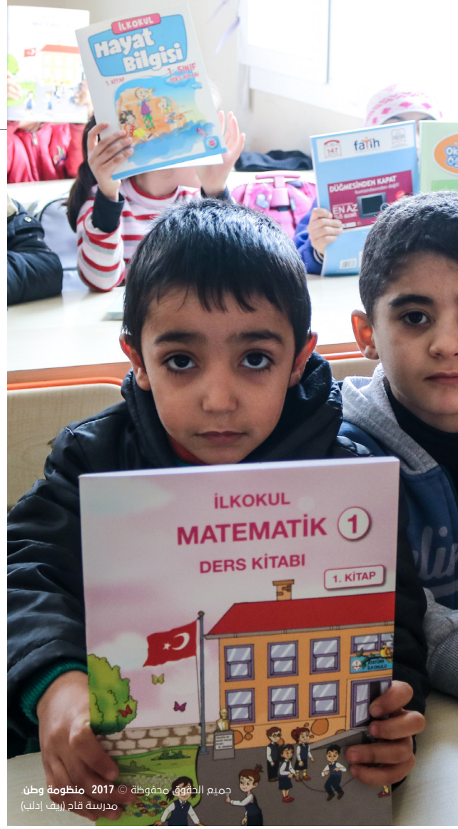
جميع الحقوق محفوظة © 2017 منظومة وطن. مدرسة قاح (ريف إدلب)